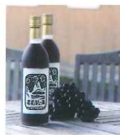
スチューベンをぜいたくに使った葡萄ジュース。