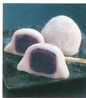
フレッシュなスチューベンの酸味が絶妙なスチューベン大福。

鶴の舞橋観光施設ここにもあるじやは、鶴の舞橋から徒歩3分の場所に位置しており、鶴田町の特産品を使用したお土産や、ひんやりスイーツや軽食が楽しめるイートインスペースを完備しています。