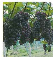
生菓のスチューベンは精度20度以上もあり、驚きの甘さ。