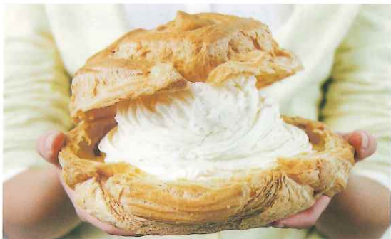
メディアにも度々取り上げられる「びっくりパン」。写真のシュークリームは普通のシュークリーム9個分相当の大きさ。